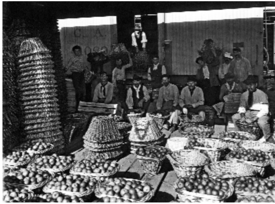
Mercado de frutas del Tigre, 1910

El sector agropecuario no quedó al margen de estos cambios. Su lógica de funcionamiento se vio radicalmente afectada.