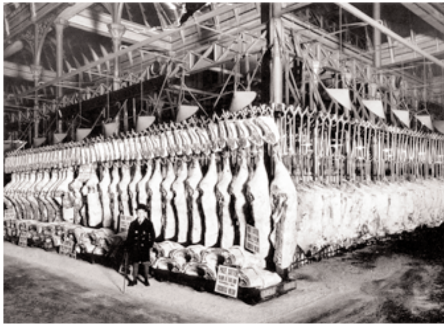
Carnes argentinas exhibidas en un mercado de Londres, 1925 (Gentileza Banco BICE, extraído del libro Producción y trabajo en la Argentina)

La actual política de dólar caro, en contraste con ese cuadro sombrío, ha funcionado como un estímulo para la producción doméstica de bienes. Por un lado, el dólar caro incrementó el costo de las importaciones; se transformó entonces en una verdadera protección cambiaria. Los productos importados triplicaron su precio en pesos, abriéndose así algún espacio para la aparición de ciertas industrias domésticas, que vinieron a sustituir a esas importaciones encarecidas por el tipo de cambio. Pero, además, los productos argentinos, con sus costos nominados en pesos, se abarataron en el exterior, de manera que nuevas